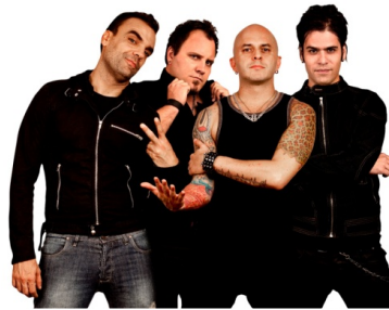
Foto aparecida en El Diario “El mercurio” el 5 de septiembre de 2016

Dos brasileños, dos argentinos, viven en Francia. Uno es bajista, otro baterista, otro guitarrista y otro cantante en Pez Apesta, una banda de rock. Descripción física según la foto y carácter imaginado. Uno tiene tatuajes debido a su religión, etc