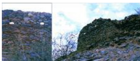
Fig. 3. Recinto de los Ojitos.