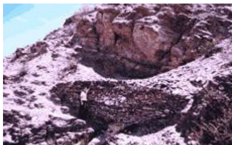
Fig. 2. Plataforma Tricolor.