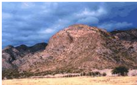
Fig. 1. Cerro del poblado de Rincón Chico.

Como un magnífico ejemplo de la importancia del sol en las prácticas de observación astronómica realizadas por las antiguas sociedades de los Andes del sur, el observatorio solar de Rincón Chico quedó en este poblado a pesar de los siglos. Allí, desde hace mil años, sus monumentos están mirando y marcando el punto más austral del recorrido del sol en el horizonte, a donde llega una y otra vez y nunca cruza más allá. Su frontera.