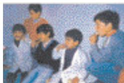
FIGURA 6: Ejecución del componente salud bucal en la escuela.

Fueron realizadas las siguientes actividades vinculadas con el mencionado objetivo: