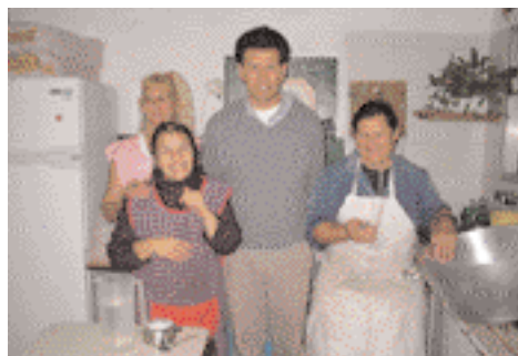
FIGURA 5: Grupo comunitario de apoyo. Participantes en el programa.

actores involucrados (el niño, el joven, el maestro, la familia, la escuela como colectivo, los integrantes del Equipo de Salud) se registraron los patrones que la lengua vehiculiza en la cultura de los diversos integrantes del grupo objetivo. El corpus sobre el que se trabajó la relación pragmática del discurso en este componente del proyecto, surgió de encuestas / cuestionarios, cuyo diseño textual fue validado y los resultados comunicados en encuentros técnicos.