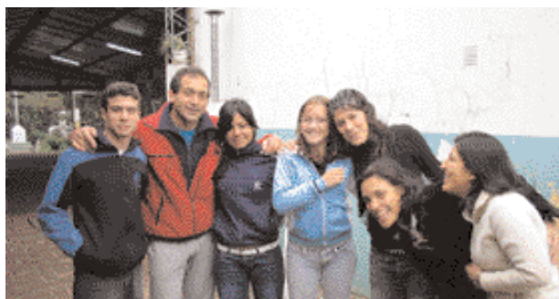
FIGURA 4: Estudiantes secundarios y profesional local.