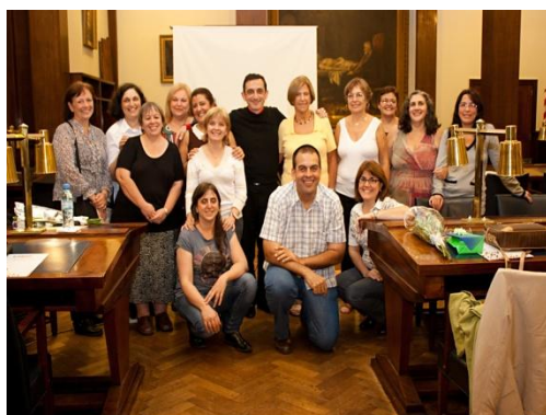
Foto con algunos asistentes al evento