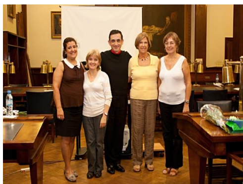
Algunos integrantes de la Cátedra DeCSA, FILO/UBA